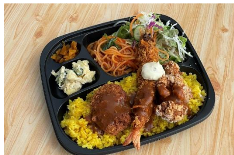
AC-04 特製トルコライス弁当

エビフライ、ヒレカツなどが乗ったボリューム満点のトルコライス。 1,500円 (税込)