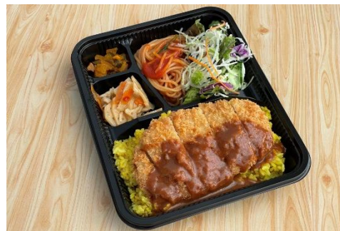
AC-02 トルコライス弁当