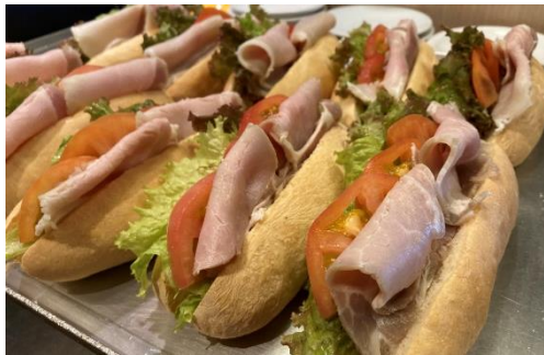
AC-01 野菜たっぷりサンドイッチBOX

長崎港を一望出来る商業施設「長崎出島ワーフ」の1Fにあるカフェレストラン。 長崎名物の“トルコライス”や龍馬カプチーノ、本格ナポリピッツァなどあります。