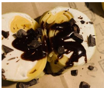
C-04 チョコチップクリーム