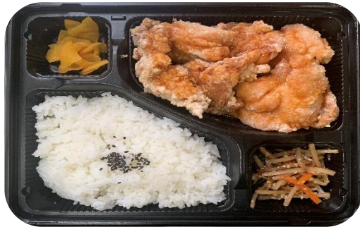
ミツ-05 ミラクル弁当