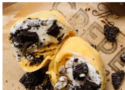
C-06 クッキー&クリーム