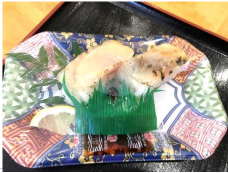
中崎-03 長崎ふぐ炙りバッテラ (2貫入/1P)

ふぐバッテラは大変珍しい商品です。ふぐ問屋だからできるふぐのバッテラをお楽しみ下さい。 700円 (税込)