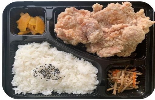
ミツ-03 プレーン弁当

福まん家のから揚げは、雑味のない上品な味わいの平戸のあご出汁と貴重な長崎・五島列島の椿油を使い少し甘めな味付けで丁寧に仕込んでいます。長崎ならではの食材や味付けにこだわった『福まん家』のからあげ弁当をどうぞ。