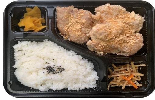
ミツ-04 ガーリック弁当

あご出汁唐揚げに、ガーリックパウダーをのせニンニク風味のガツンと効いたから揚げ弁当です。