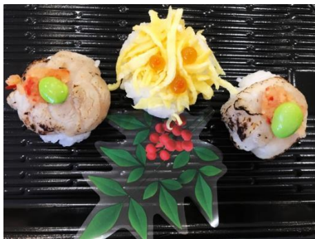
中崎-05 長崎ふぐ手毬寿司 (3貫入/1P)

炙りふぐとふぐを錦糸卵で包み込んだ2種類の手毬寿司です。見た目も華やかな商品です。 700円 (税込)