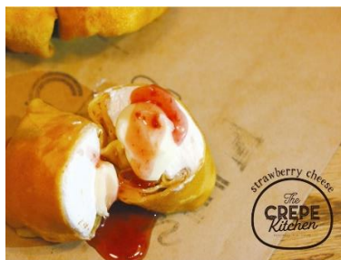
C-05 ストロベリーチーズ