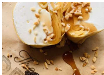
C-02 キャラメルナッツ