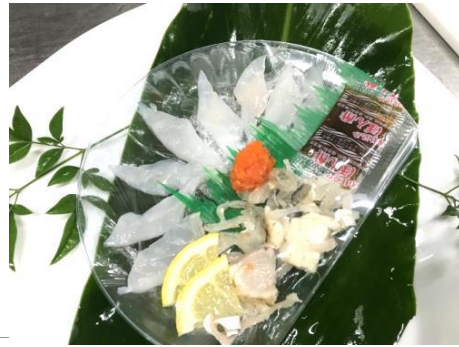
中崎-04 長崎トラふぐ刺し盛 (1人前)

ふぐは「福」とも呼ばれ、縁起の良いお魚です。ぜひパーティーでお召し上がり下さい。 1,200円 (税込)